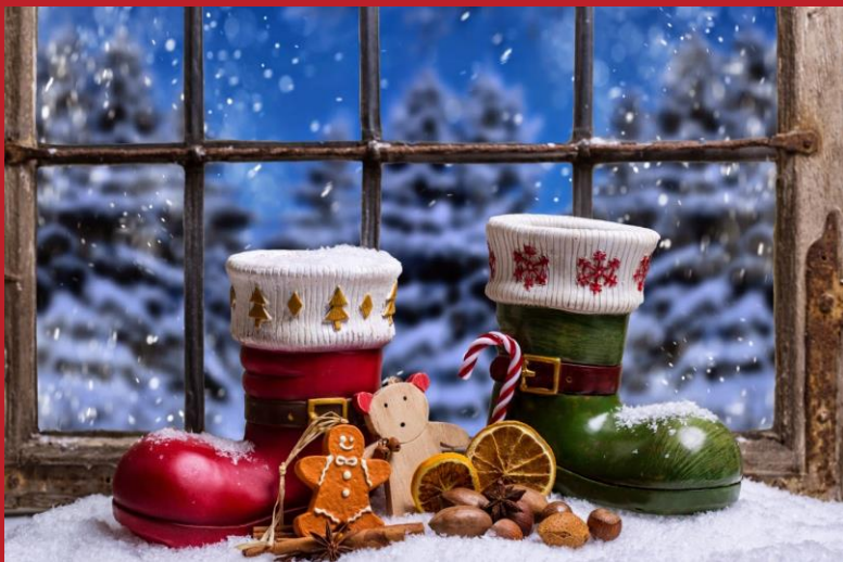
Add caption here