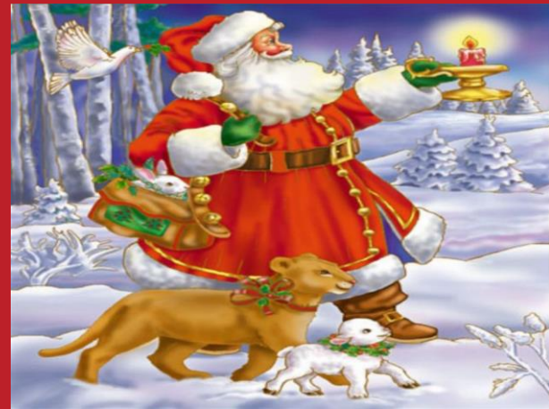
Add caption here