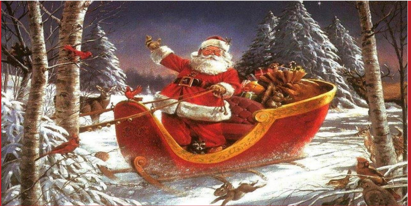
Add caption here