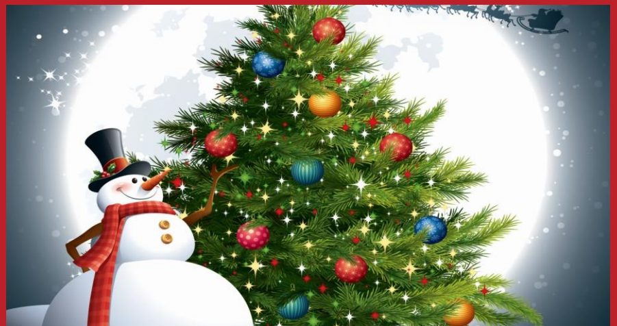
Add caption here