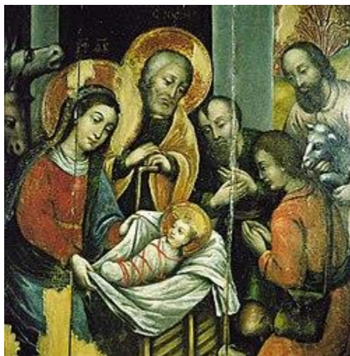
Icoana cu Nasterea Domnului din secolul al XVIII-lea, regiunea Moghilau .

In Romania, Craciunul este sarbatorit timp de trei zile, cu ziua de 25 decembrie in prim-plan, urmata de a doua zi de Craciun, pe 26 decembrie . Este o sarbatoare publica in multe tari, celebrata religios de majoritatea crestiniilor si cultural de multi necrestini, devenind un moment de bucurie care uneste familiile si comunitatile intr-un spirit autentic de sarbatoare.